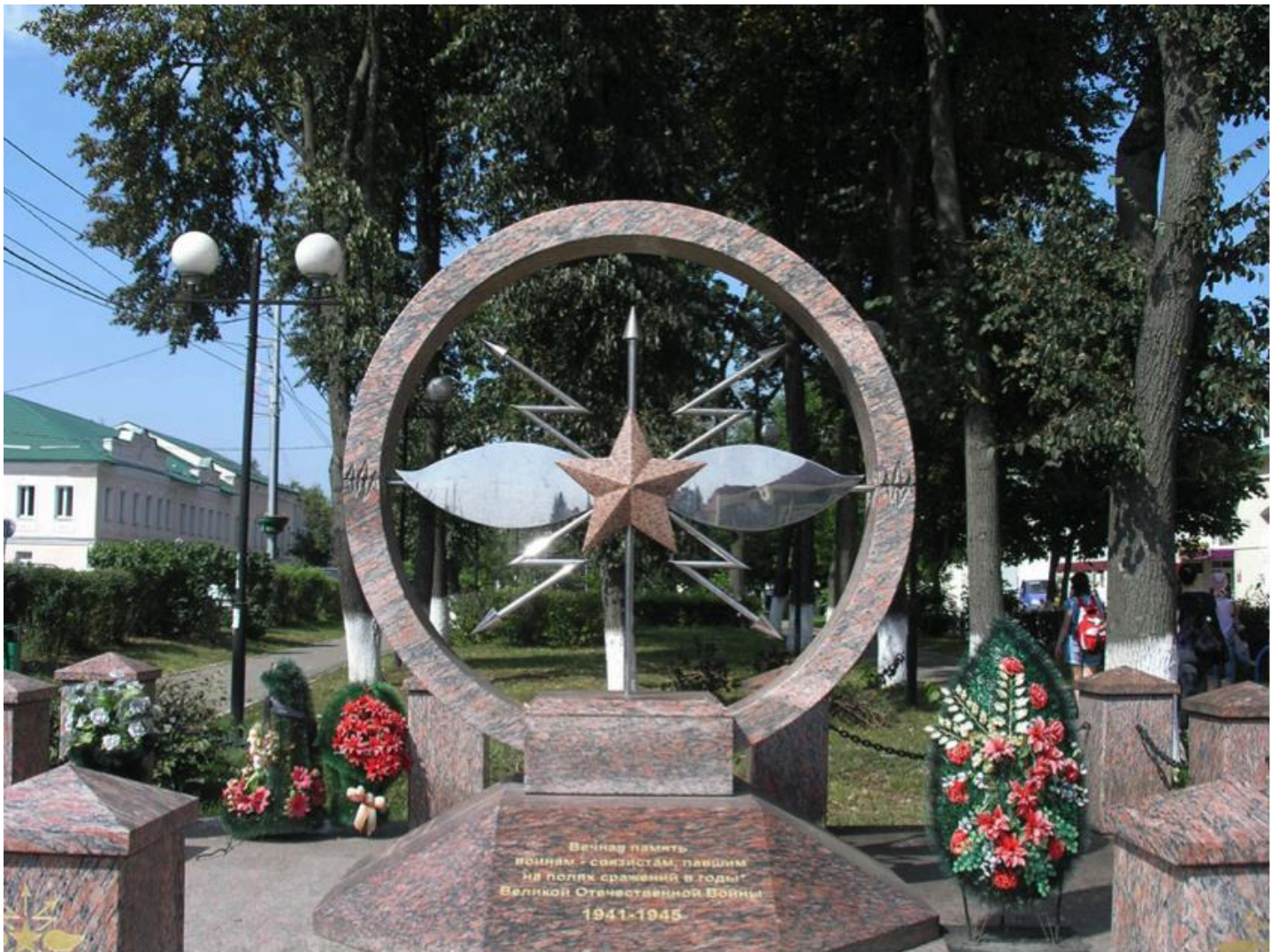
Первый в России памятник в честь военных связистов открыт 11 мая 2005 г. в мемориальном комплексе героев Великой Отечественной войны Можайска