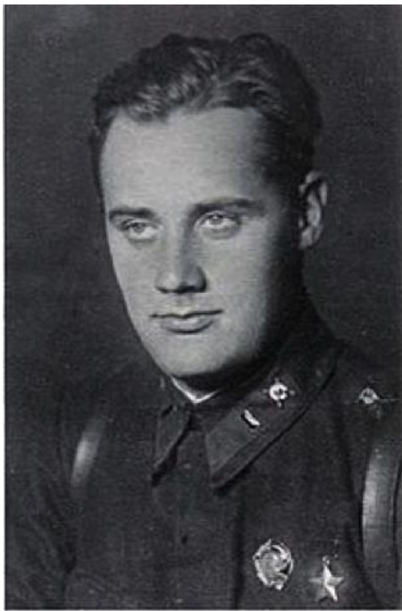
Арнольд Константинович Мери (1919—2009)

Начальник радиостанции взвода связи 2-го батальона 758-го стрелкового полка 88-й стрелковой дивизии Карельского фронта, входившей в Кемскую оперативную группу, ефрейтор Федор Лузан обеспечивал связь и координировал боевые действия батальона, находившегося в окружении, с командованием полка. Батальон вел бой с численно превосходящим противником, отбивая одну атаку за другой. 24 ноября 1941 года в бою за участок железной дороги в Лоухском районе Карелии прорвавшиеся немецкие автоматчики при поддержке танка приблизились к блиндажу, где находился Ф. Лузан со своей радиостанцией. В критический момент Лузан вызвал огонь советской артиллерии на себя, а при прорыве фашистов в блиндаж, где работала рация, Фёдор Лузан взорвал гранатой себя вместе с группой врагов. Указом Президиума Верховного Совета СССР от 22 февраля 1943 года ефрейтору Фёдору Афанасьевичу Лузану посмертно присвоено звание Героя Советского Союза.