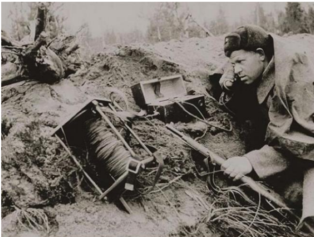
Военные связисты на переднем крае

особенно в критических ситуациях. Поэтому труд связиста на войне — самый необходимый, самый почетный и ответственный, от него часто зависит успех боя и всей операции».